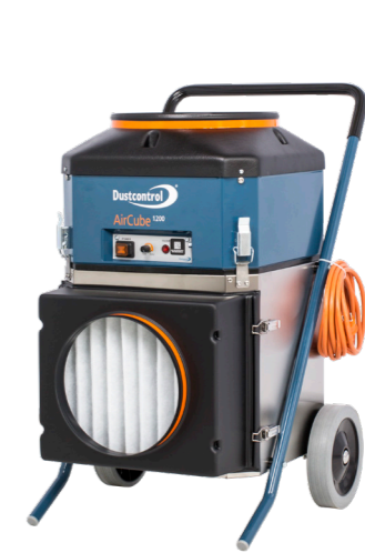
DC AirCube 1200