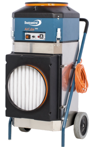
DC AirCube 2000