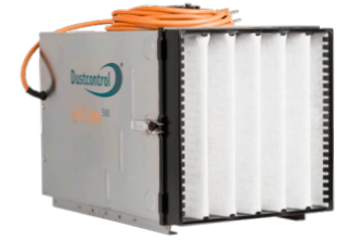
DC AirCube 500