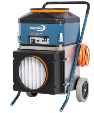
DC AirCube 1200