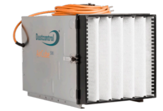
DC AirCube 500