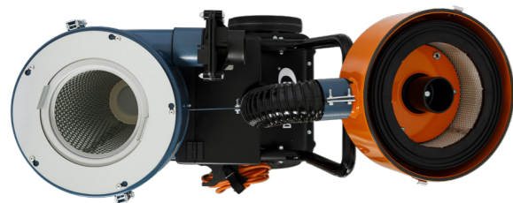
Låsring för förfilter