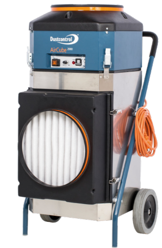
DC AirCube 2000