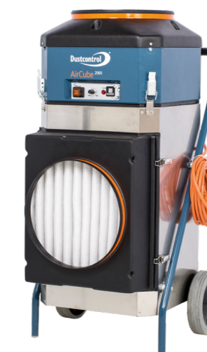
DC AirCube 2000