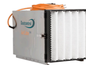
DC AirCube 500