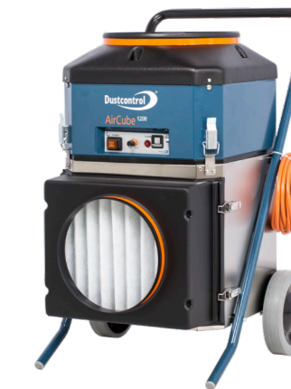
DC AirCube 1200