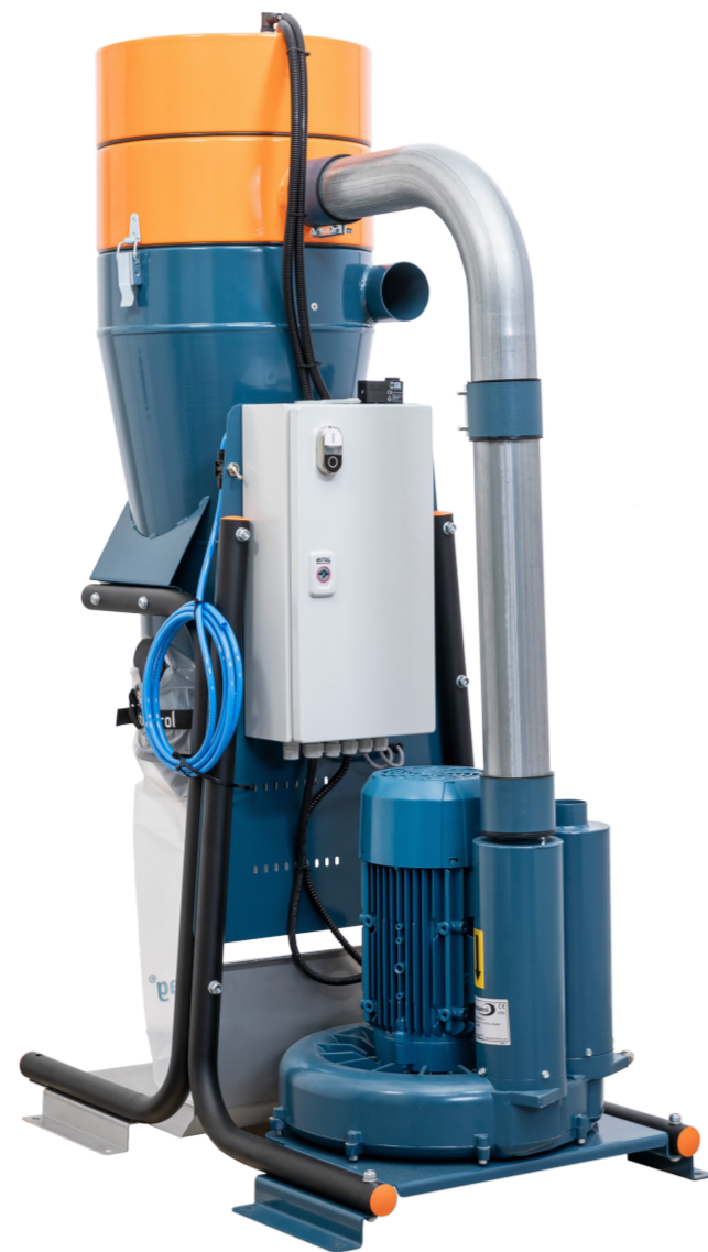
TROMB Stationary med Smart Panel Compact