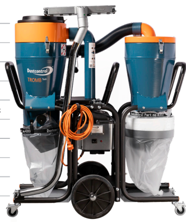
Art.nr. DCTROMB H 400 Twin 172540 aL TWIN 230 V/3000 W 172550 LL TWIN 230 V/3000 W 172520 aa TWIN 230 V/3000 W 172500 cc TWIN 230 V/3000 W 172530 cL TWIN 230 V/3000 W

Anslutningshylsa (2129) Anslutningsmuff (2008) Sugslang antistatisk (Ø 50 mm) 5 m (2013) Golvmunstycke (B500 mm) (7238) Sugrör Ø 50 mm (7265) c-modell (cc) med 10 x plastsäckar (43619) L-modell (cL) med Longopac 25 m (432177) + 10 x plastsäckar (43619) Finfilter, polyester (44017) HEPA H13-filter (44016)