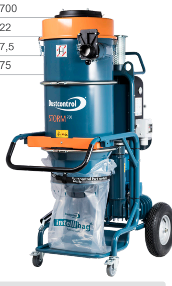
Art.nr. DC Storm 500 119402 a 400 V/50 Hz / 4 kW 119400 c 400 V/50 Hz / 4 kW 119430 L 400 V/50 Hz / 4 kW Art.nr. DC Storm 700 119418 a 400 V/50 Hz VFD 119403 c 400 V/50 Hz VFD 119419 L 400 V/50 Hz / 7,5 kW VFD

Anslutningsmuff (2107) Anslutningsmuff (2008) a) L) Sugslang antistatisk (Ø 50 mm) 7,5 m (2013) c) Sugslang (Ø 50 mm) 7,5 m (2401) Golvmunstycke B500 mm (7238) Sugrör (Ø 50 mm) (7265) a) Behållare 75 l (7368) c) 10 x plastsäckar (46145) L) Longopac 25 m (44077) Finfilter, polyester (44212) HEPA H13-filter (42869) till DC Storm 500 HEPA H13-filter (52807) till DC Storm 700