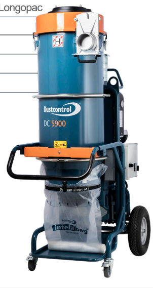
Art.nr. DC 5900 9,2 kW S c/a 119340 a 400 V 119341 c 400 V Art.nr. DC 5900 9,2 kW P a/c/L 119305 a 400 V 119301 c 400 V 119333 L 400 V Fler alternativ på dustcontrol.se

Finfilter, polyester (4292) HEPA H13 filter (42807)