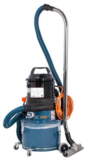
Art.nr. DC 1800 H 101800 230 V/50 Hz 101801 230 V/50 Hz Auto start

Sugslang med muff (Ø 38 mm), 5 m (2105) Anslutningsmuff (2108) Golvmunstycke (B370 mm) (7235) Sugrör Ø 38 (7257) Plastsäck (42292) Säckstöd (42369) Finfilter, cellulosa (42029) HEPA H13-filter (42027)