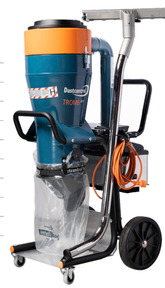
Art.nr. DCTROMB 400 172000 a 230 V 3000 W 171500 c 230 V 3000 W 171530 L 230 V 3000 W

Anslutningshylsa (2129) Anslutningsmuff (2008) Sugslang antistatisk (Ø 50 mm) 5 m (2013) 171530 och 172000 Sugslang (Ø50 mm) 5 m (240105) för modell 171500 Golvmunstycke B500 mm (7238) Sugrör (Ø 50 mm) (7265) Säckstöd (42369) Finfilter, polyester (44017) HEPA H13-filter (44016)