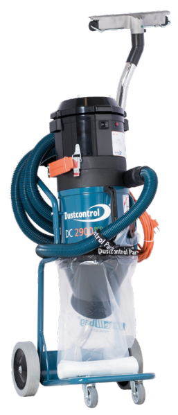
Art.nr. DC 2900 H 121100 a 230 V/50 Hz Auto Start 120100 c 230 V/50 Hz Auto Start 122100 L 230 V/50 Hz Auto Start

Sugslang (Ø38 mm) med muff, 5 m (2105) Anslutningsmuff (2108) Golvmunstycke B370 (7235) Sugrör Ø 38 mm (7257) Plastsäck (42702) Finfilter, cellulosa (42029) HEPA H13-filter (42027)