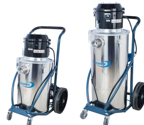
Art.nr. DC 50-W 118600 230 V, 50 Hz, EU Art.nr. DC 75-W 118700 230 V, 50 Hz, EU

Anslutningsmuff (2108) Anslutningshylsa (2115) Sugslang Ø 38 mm, 5 m antistatisk (2012) Golvmunstycke B370 mm (7236) Sugrör Ø 38, aluminium (7258) Filtersäck (42190)